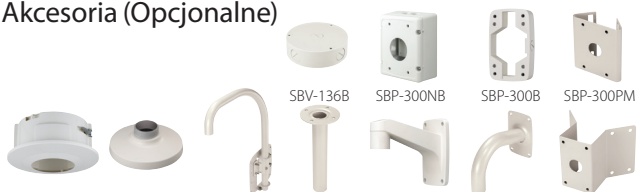
SHD-3000F3 SBP-301HM2 SBP-300LM SBP-300CM SBP-300WM1 SBP-300WM SBP-300KM